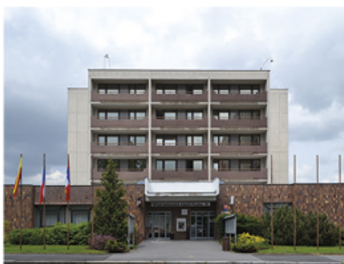
Projekt Prahy 15 potvrdil kvalitu zde poskytovaných služeb.

Po dobu projektu byli pracovníci účastní několika šefení, která se věnovala jejich profesním a manažerským schopnostem při vedení jednotlivých oddělení a odborů úřadu. Odborníci, kteří vedli rozhovory a šefení s pracovníky, se zaměřili na vnitřní funkce a efektivitu pracovních činností stejně jako na externí funkce úřadu při každodenním styku s občany Prahy 15. Vedoucí zaměstnanci procházeli v období projektu také pravidelnými školeními, která rozvíjela měkké i tvrdé dovednosti každého vedoucího pracovníka. Výsledkem projektu byla důkladná analýza efektivit pracovních činností vedoucích zaměstnanců a rovněž doporučení a úprava interních dokumentů.