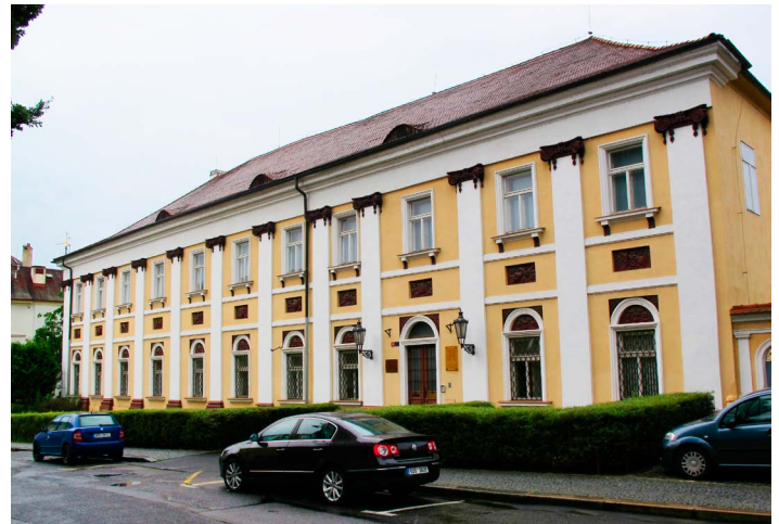
Budova SOA v Litoměřicích.

„Z finančních prostředků projektu bude také pořízena nová verze archivního softwaru pro dálkový přístup k digitalizovaným archiváliím.