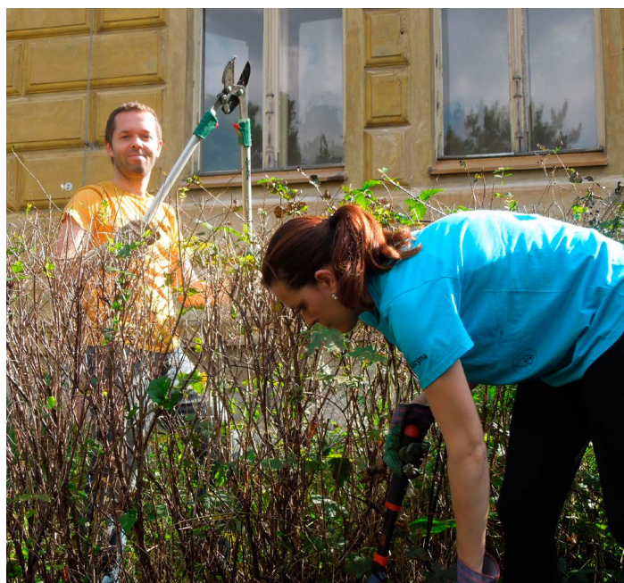
Loňský dobrovolnický den OSF.

Zaměstnanci Odboru strukturálních fondů se po roce opět chystají pomoci Dětskému centru při Fakultní Thomayerově nemocnici v Praze - Krči. První podzimní den (23. září 2015) vyrazí na zdejší zahradu hrabat listí a stříhat náletové křoviny.