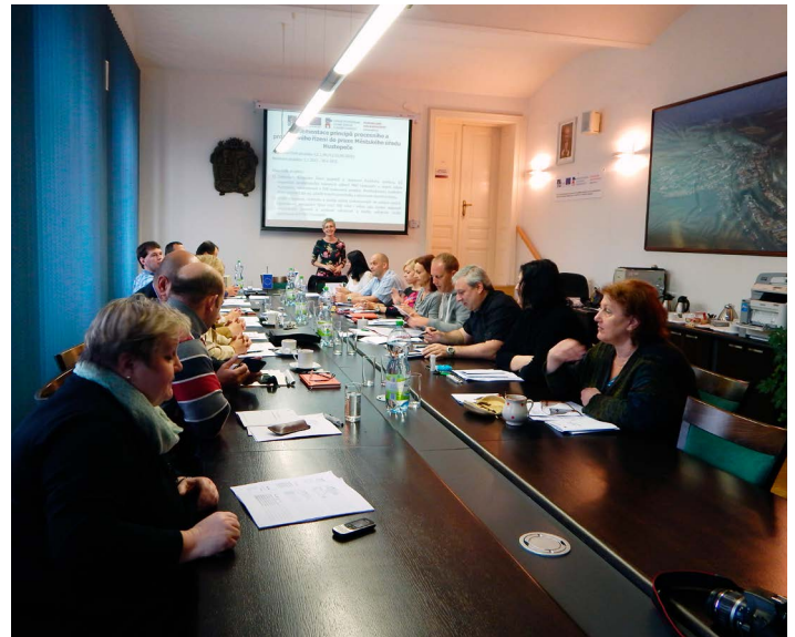
MěÚ Hustopeče zkvalitnil projektové a procesní řízení.

„Výstupy projektu budou využitelné i během následujících let“